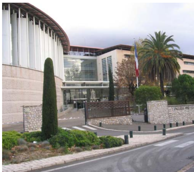
Ci-contre / Tribunal de Grande Instance de Grasse